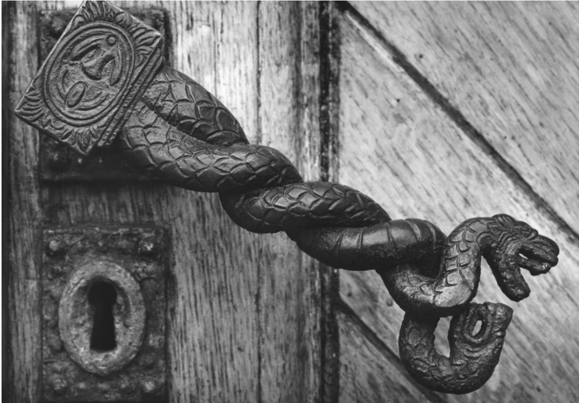
Fra hoveddøra i Borgund kirke (Ålesund)